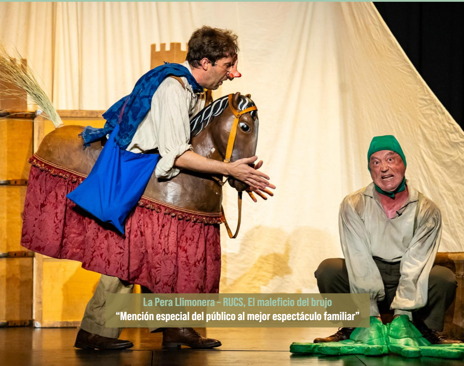
La Pera Llimonera – RUCS, El maleficio del brujo “Mención especial del público al mejor espectáculo familiar”