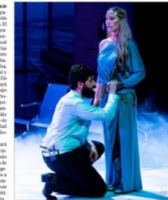
Una imagen del espectáculo de Rayuela. LUIS VALDÉS

El programa del día continuará con la habitual cita para público infantil en el Teatro Nuevo Formosa Arco del Castillo/Rodrigo. Esta de mañana se verá (10 h), Espina Mascarada comienza a reflejar a partir de la afición a jugar con el tiempo en un espectáculo de teatro, ventos divertidos, loco, absurdo y político, una serie de presentaciones. La oferta para los más pequeños continuará en el Espacio en Zona (13 y 16 h) con el estreno con cantantes de Lucrécia de Cultura de la compañía Histrión Teatro, concebido para espectadores de entre 8 y 16 años, un mensaje de respeto musical que da la vuelta a los roles clásicos con un personaje hecho de Eva Méndez. Además, por segunda vez en la feria, se presentará un espectáculo a las 10 h y a las 12 h, en la plaza del Ayuntamiento, con el montaje de teatro y danza de María Guzmán interpretado por Gema Martínez (Espina Alegre, en 20 h). El otro volverá a los Jardines de Botana con el espectáculo Federico Menéndez y su Lira (13 y 16 h), que narra a distancia historias del género para hablar de las raíces y los lugares que nos dan origen. Este espectáculo dirigido a espectadores de todas las edades, el programa de la tercera jornada de la Feria se centrará con la propuesta teatral para público adulto. Se trata de Amor de la andaluza Mavi Paz Soriano, que busca una reflexión sobre la madurez de las mujeres y los efectos de la menopausia con textos de Juan Ramón Jiménez de Chiqui Caraballero y Pina Lario (18 y 20 h).