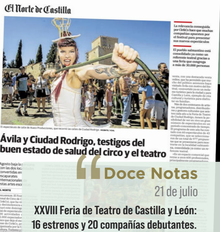
El Norte de Castilla

6 Compañías dentro del Programa Divierteatro