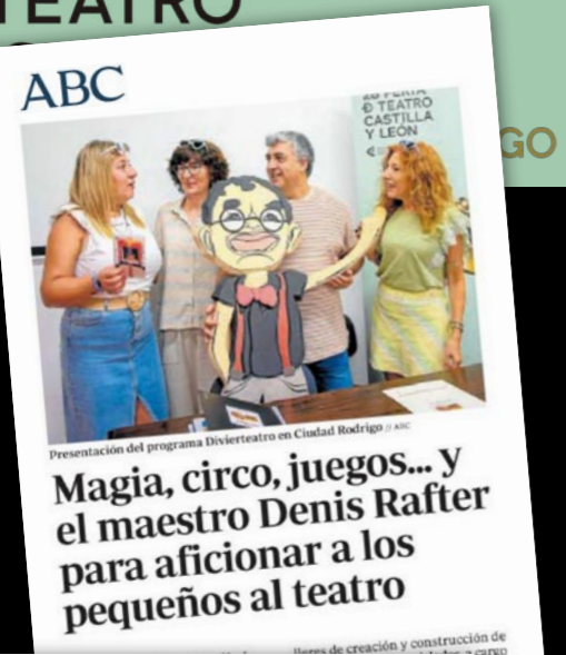
Presentación del programa Divierteatro en Ciudad Rodrigo