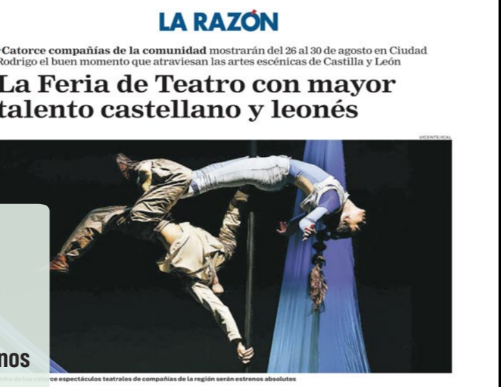
LA RAZÓN Catorce compañías de la comunidad mostrarán del 26 al 30 de agosto en Ciudad Rodrigo el buen momento que atraviesan las artes escénicas de Castilla y León

Agosto baja la r con las dos loc convertidas en escaparates internacionales estas artes esc... Doce Notas 21 de julio XXVIII Feria de Teatro de Castilla y León: 16 estrenos y 20 compañías debutantes.